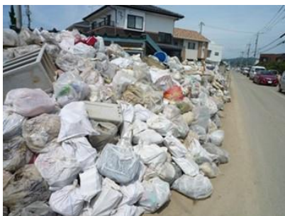
道路横に積み上げられた災害廃棄物