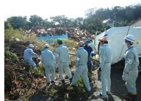
災害廃棄物の収集運搬にかかる助言の様子