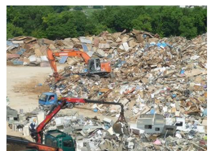
災害廃棄物の仮置場の管理