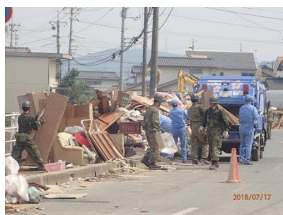
自治体等支援による災害廃棄物の収集