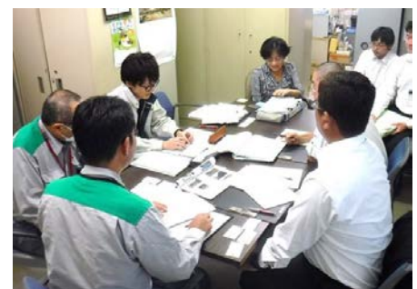
災害廃棄物処理の補助金に関する説明の様子