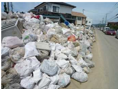
道路横に積み上げられた災害廃棄物