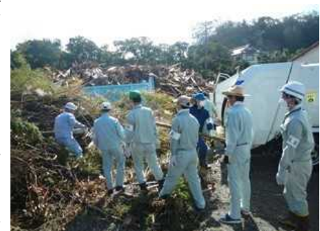
災害廃棄物の収集運搬にかかる助言の様子