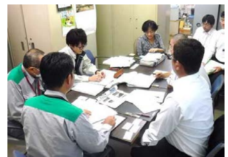
災害廃棄物処理の補助金に関する説明の様子