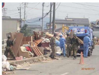
自治体等支援による災害廃棄物の収集