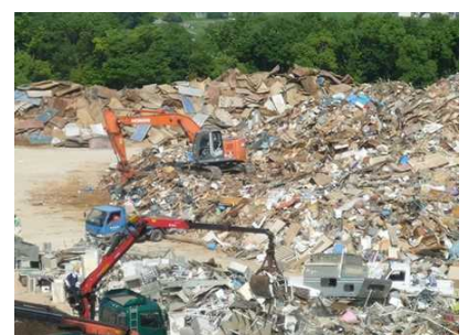
災害廃棄物の仮置場の管理