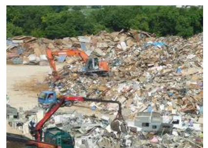
災害廃棄物の仮置場の管理