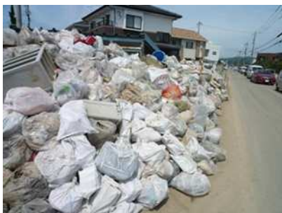
道路横に積み上げられた災害廃棄物