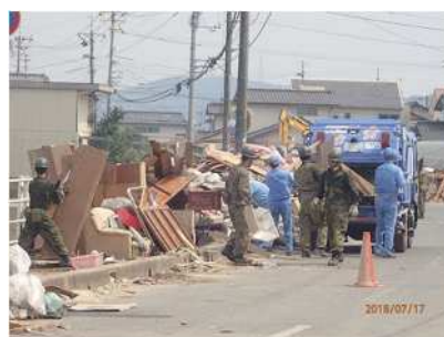
自治体等支援による災害廃棄物の収集