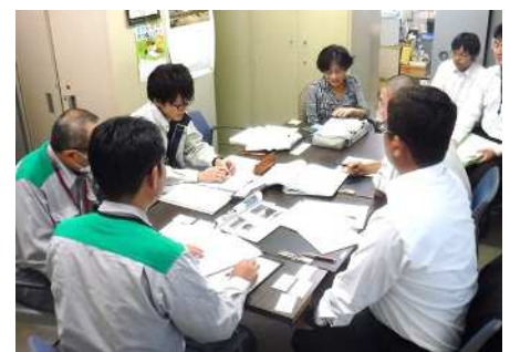
災害廃棄物処理の補助金に関する説明の様子