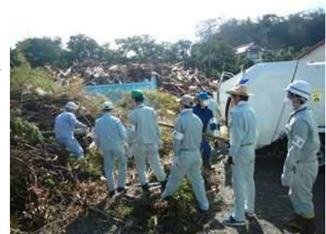
災害廃棄物の収集運搬にかかる助言の様子