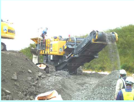
岩手県大槌地区のコンクリートがら破砕ライン (H24.10 からフル稼働開始)