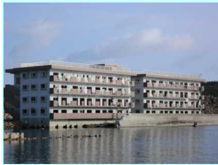
解体前 (H23年12月17日撮影)