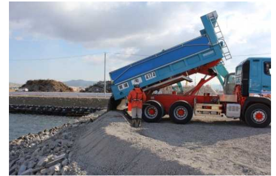
石巻港区廃棄物埋立護岸整備事業 (H25.2.20～開始)