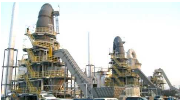
福島県相馬市仮設焼却炉 (H25.2.20～本格稼働開始)