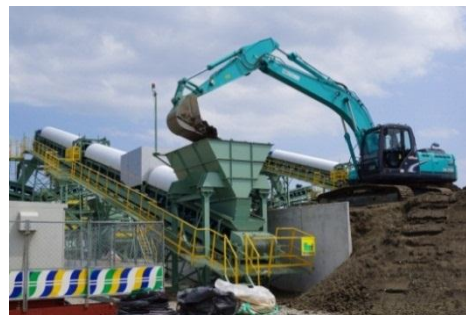
岩手県陸前高田市の津波堆積物処理施設 (H25.5.7本格稼働開始)