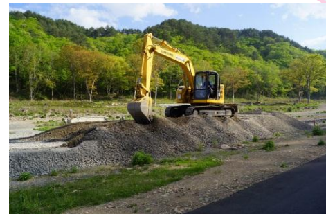
岩手県宮古市「中の浜園地再整備事業」 (H25.5.23～ 津波堆積物利用開始)