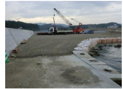
宮城県南三陸町の志津川漁港南防波堤復旧工事