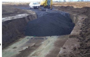
名取市のサイクリングロード工事事業 (H25年11月開始)