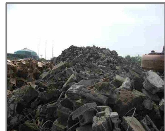
仮置状況(コンクリートブロック)