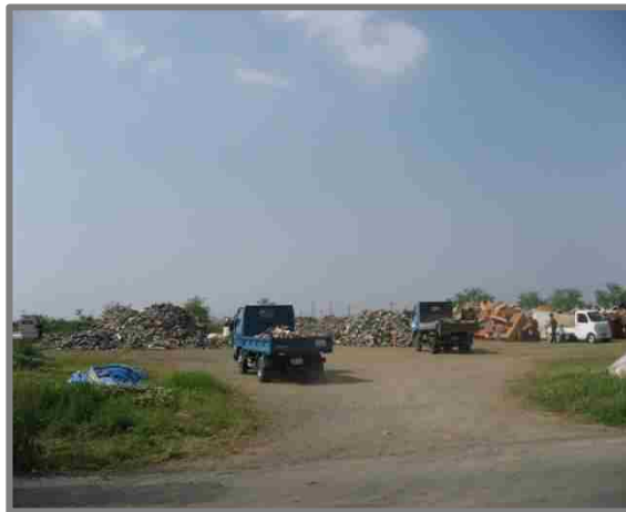
嘉島町仮置場(全景)