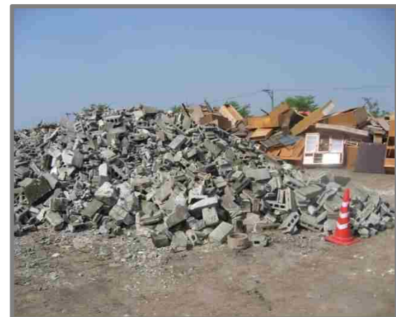
仮置状況(コンクリートブロック)