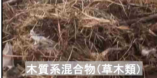
木質系混合物(草木類)