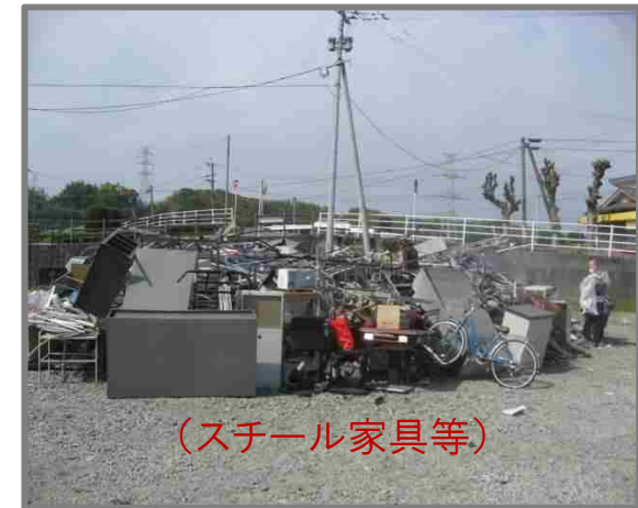
仮置状況(金属製品)