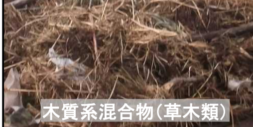
木質系混合物(草木類)