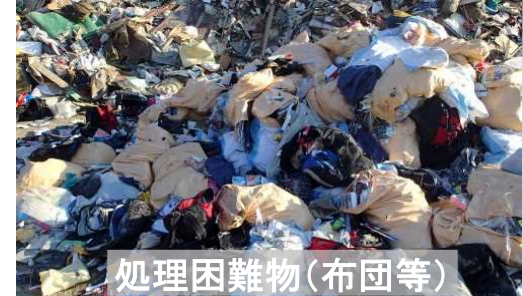
処理困難物(布団等)