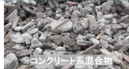
コンクリート系混合物