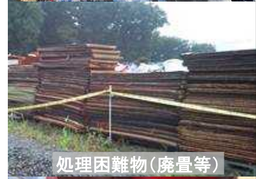
処理困難物(廃畳等)