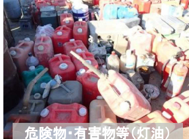
危険物・有害物等(灯油)